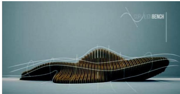
صورة (2) الانسيابية في الأثاث تميز التصميم بالحيوية والديناميكية وتتوافق مع ارجنومية الجسم البشري بنسب محسوبة كما يمكن تعديل التصميمات وتطويرها وتغيير وظائفها

كما طرأ الكثير من التطور علي الأثاث نتيجة الاستخدام الموسع لبرامج التكنولوجيا الرقمية الي ان ادي الي تطور تصميمات الأثاث و جعلها أكثر تحرراً وديناميكية بفضل تلك الوسائط الجديدة للتصميم ،ويتمتع استخدام الانسيابية في الأثاث بالتفكيكة مع التأكيد على ديناميكية التشكيل وتتميز بالاندماج و التكامل مع الفراغ المحيط كما تتميز بالمرونة والاندماج بين التصميم الداخلي والخارجي محققة مبدأ التفاعل وذلك باستخدام اجهزة الحاسب الالى التي ساهمت في عمل طفرة ثورية في مجال الفكر التصميمي الابداعي باستخدام برامج تصميم عادية دون برامج التكنولوجيا المتقدمة (كالميا Maya والرأينو Rhinoceros) وغيرها من البرامج المعدلة والمخصصة لتصميمات أكثر تعقيداً يساعد علي عمل الاسطح المنحنية والشبه منحنيه، كما في صورة (2) - (5 - ص 12) .