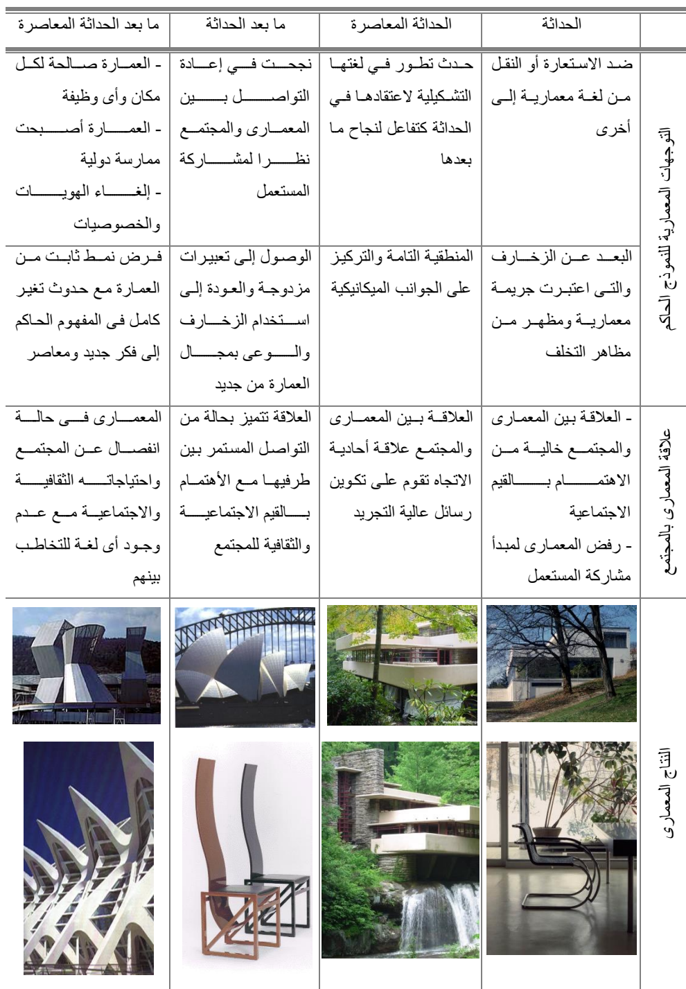
جدول رقم (1) الدراسة التجميعية للاتجاهات الفكرية والمعمارية العالمية (9 - ص 243)