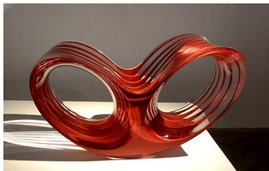
صورة " 9 " المقعد ذو خطوط انسيابية من ناحية الشكل ولكن لو نظرنا إلى دوره الوظيفي نجد أن به عدم اتزان وظيفي.

وتصميم كتل انسيابية وهى كتل يكون مبالغ فى تصميمها حيث أنها لا تؤدي الجانب الوظيفي ولا يتحقق بها اي نوع من انواع الاتزان فى التصميم، وبهذا يكون بها خلل من ناحية الاستخدام، وفى غالب الأمر تستخدم تلك الكتل لشغل حيز الفراغ أو للتجميل أو لإتزان التصميم كما يظهر بصورة (9، 10) - (1- ص 112).