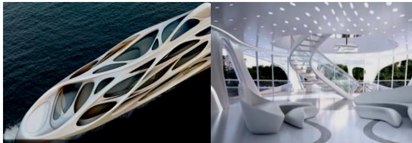
صورة (4) صور ليخت تصميم زاها حديد توضح التصميم الداخلي الانسيابي مستلهم من حركة الماء

وأيضاً علي نطاق التصميمات المتحركة كالبيخوت نجد صورة (4) صور ليخت تصميم زاها حديد توضح التصميم الداخلي الانسيابي مستلهم من حركة الماء ومتوافق معها ليوحي بالديناميكية والحركة كما يظهر بالتصميم الداخلي توافق وانسجام التصميم الداخلي مع التصميم الخارجي وتصميم الأثاث ليكمل التصميم بشكل انسيابي. (5- ص 13).