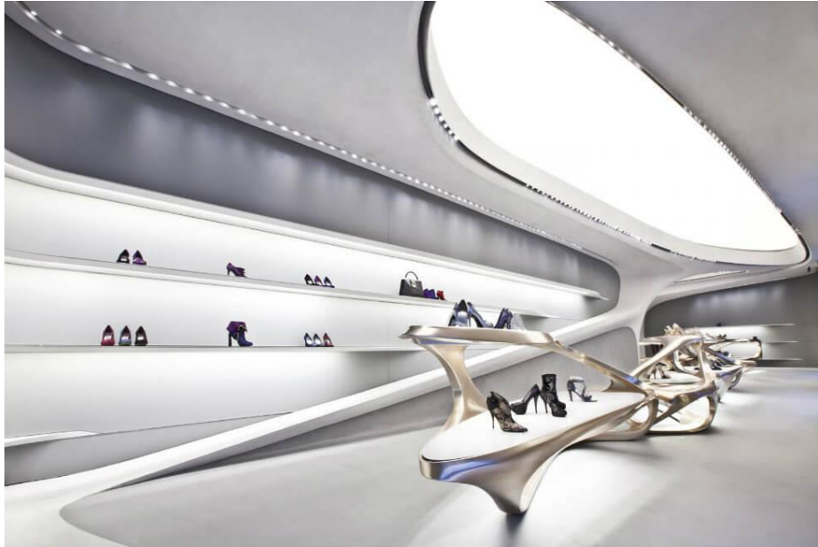
صورة رقم (7) لمحل تجاري من تصميم زها حديد - توضح استخدام الخامات المتطورة ودورها في تطويع تلك الخطوط التصميمية وترك العنان لخيال المصمم في توظيف هذه الخطوط بصورة تعكس إبداعه، مع استخدام التناسق اللوني بين وحدات الأثاث والتصميم الداخلي (14)